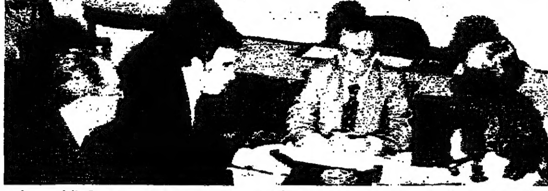
الرئيس كبريتو يترأس اجتماع مجلس الوزراء القبرصي لبحث موضوع الحلف

وكد على اهمية هذا العام بقتسية لسوق الاقتصادية في البحرين وتولي الخدمات بما يتواءم ومتطلبات الوضع الاقتصادي من مختلف الميادين لتأمين مستقبلهم في مجتمع حضري ، واصباح المجال امام الشباب واصفاً بتسلم مهام القيادة في بناء مجتمعه ما يلي طموحه ويحقق له ولايجيل القامة اعدائه في الحياة الكريمة . ومن جهة اخرى اصدر امير البحرين مرسوماً آمرا بالاعراج عمن ٢٢ مسجوناً بمناسبة العيد الوطني البحريني .